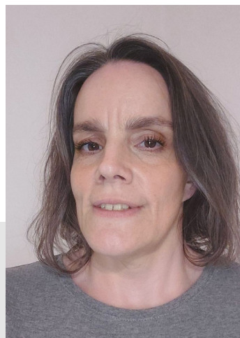
Zapisala Neža Podjavoršek

Ideje, nove zamisli, neobremenjenost z ustaljenimi vzorci. Študenti imate svež pogled na stroko, ste bližje razmišljanju mlajših uporabnikov knjižnice in zato lahko veliko prispevate k razvoju knjižničnih storitev. Od članov Sekcije študentov bibliotekarstva si želim radovednost, pripravljenost za nabiranje neformalnih izkušenj. Upam, da bodo izkoristili čim več možnosti, da se v okviru dejavnosti Zveze predstavijo bodočim delodajalcem.